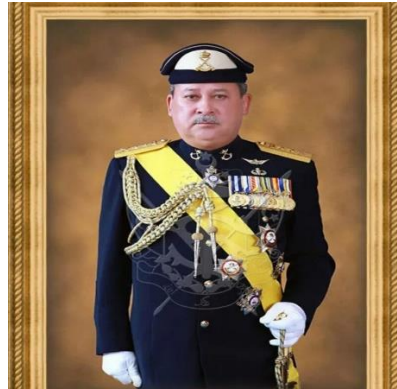
Kebawah Duli Yang Maha Mulia Seri Paduka Baginda Yang di-Pertuan Agong XVII Sultan Ibrahim Ibni Almarhum Sultan Iskandar